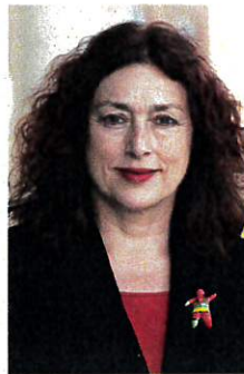
Dr. Monika Griefahn Tyskland, tidigare tysk riksdagsledamot, miljöminister i Niedersachsen, medgrundare av Greenpeace Tyskland